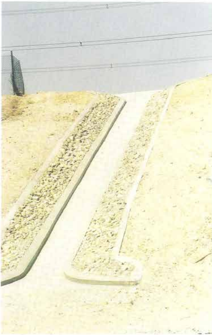
استخدامات الصخور واحجار الحجر في عمل مجري السيول والامطار Quarry Rocks are used for having a well equipped drainage