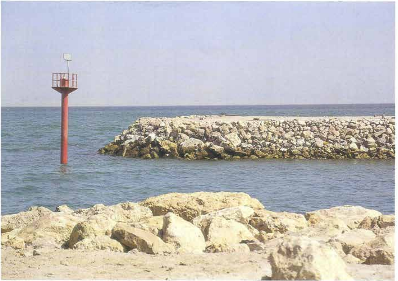
استخدام صخور الحجر في مشروع ميناء رأس عشيرج (الدوحة) Quarry rocks are used in Mina Ras Esherij ( Doha) project