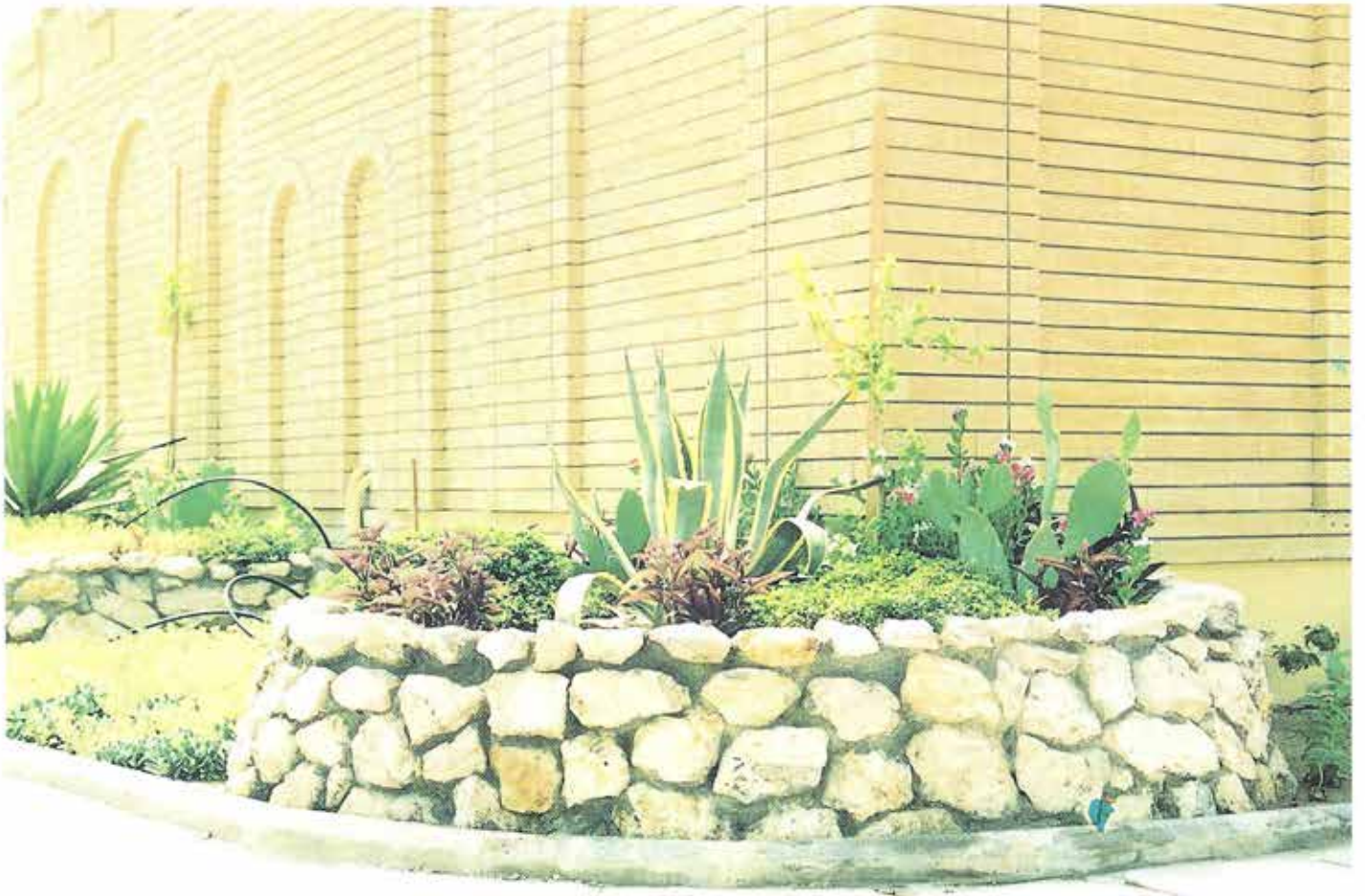
استخدام الصخور في تزيين الحدائق الخاصة والعامة. Quarry Rocks are used in decorating private & public gardens