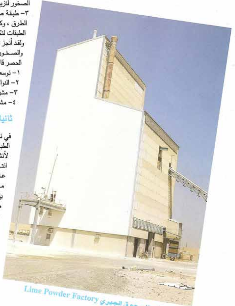
مصنع المسحوق الجبيري Lime Powder Factory

5- حجر جبيري مطحون عالي النقاوة لأستخدامات وزارة الكهرباء والماء المتعددة.