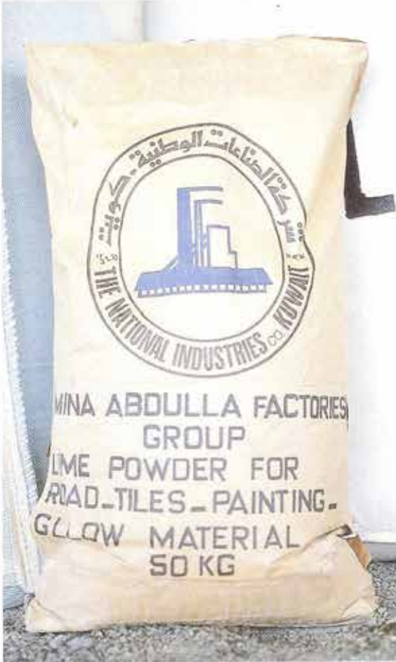
مسحوق جيرى ( الفيلتر ) Lime powder ( Filler)