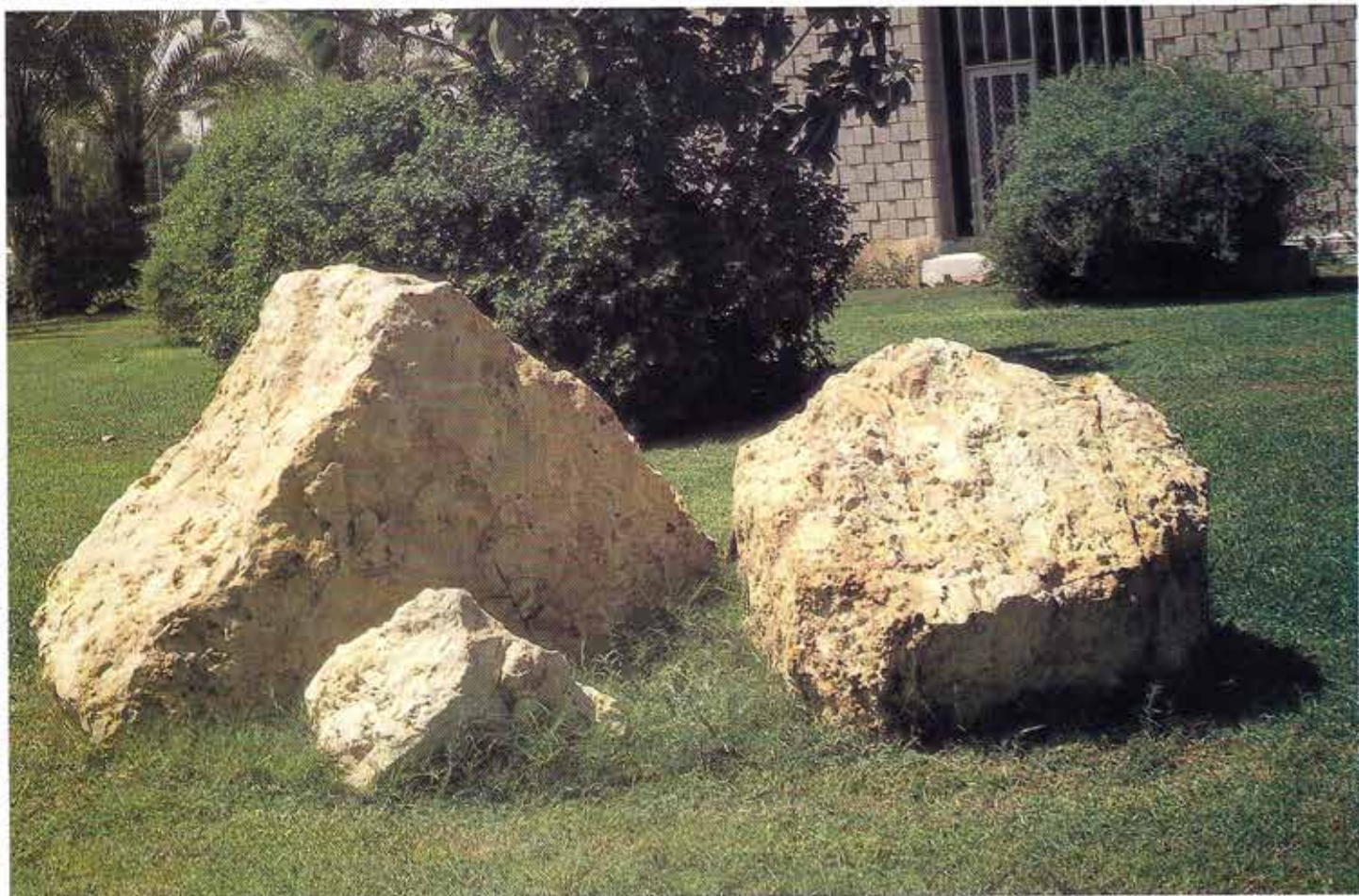
استخدام الصخور في تزيين الحدائق الخاصة والعامة. Quarry Rocks are used in decorating private & public gardens