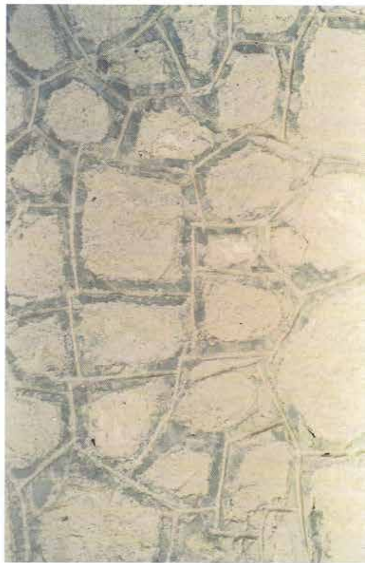
استخدام الصخور في بناء جدران الفلل والاسوار Quarry Rocks are used in building villas & fences