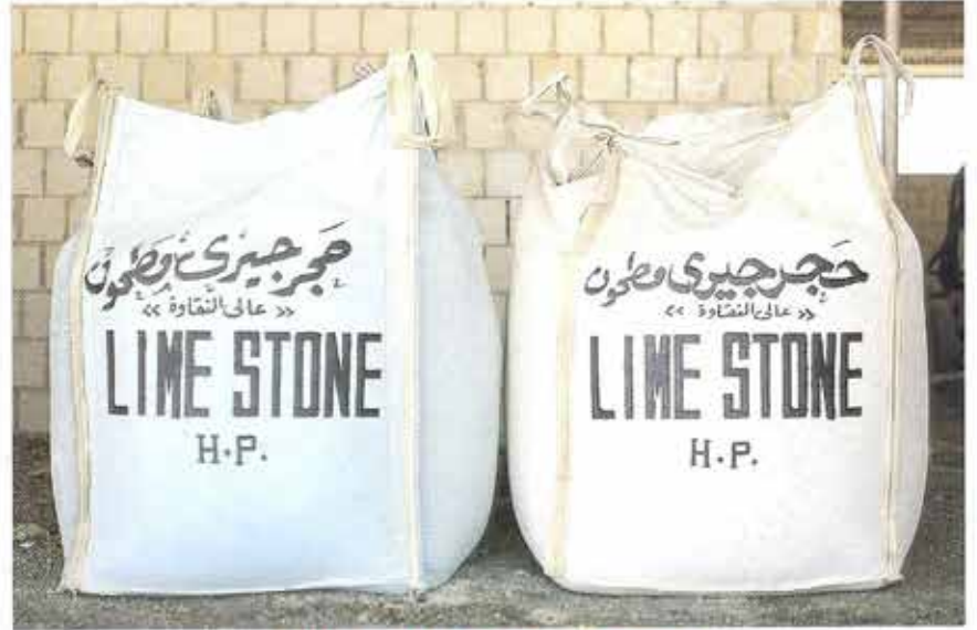
حجر جيرى مطحون على النقاوة Ground lime stone high purity