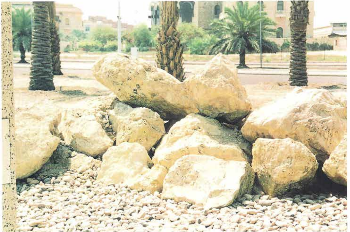
استخدام صخور الحجر بحدائق الواجهة البحرية Quarry Rocks are used in front sea gardens