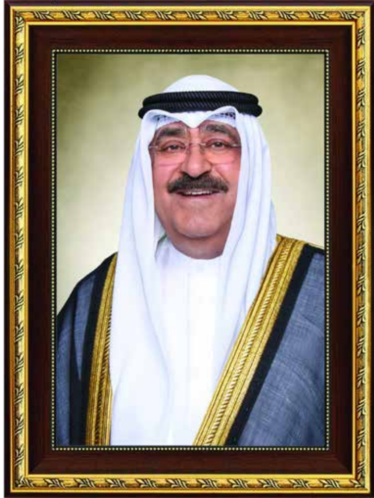
حضرة صاحب السمو الشيخ مشعل الأحمد الجابر الصباح أمير دولة الكويت